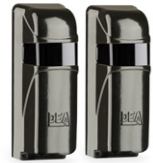
LINEAR SHIELD cod. 662047