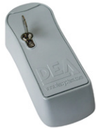
BLINDOS cod. 665000