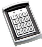
DIGIPRO cod. 663310