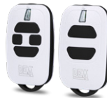
GTI2-GTI4 cod. 672635 - 672645