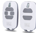
GTI2M-GTI4M cod. 672603 - 672613