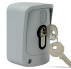
GT-KEY cod. 663090