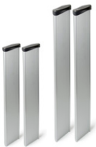
PILLY 60 -120 cod. 664000 - 664010