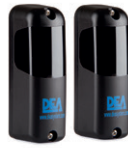
LINEAR cod. 662044