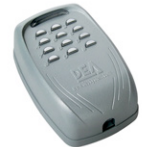
DIGIRAD cod. 663280