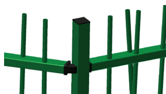
Poteau d'angle max. 100°